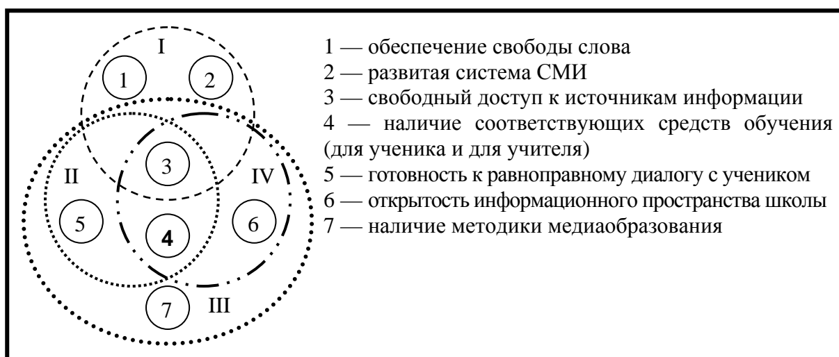
Схема 1. Система условий интеграции медиаобразования (для удобства восприятия связи между условиями внутри подсистем опущены)

Точка зрения на средства обучения как составную часть метода (И.Я.Лернер, Ю.К.Бабанский, А.В.Федоров) имеет право на существование, но мы категорически не можем с ней согласиться, поскольку метод и