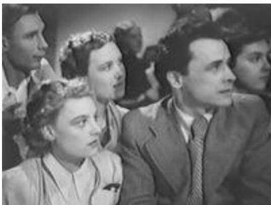
Рис. 2. Кадр из фильма «Закон жизни» (1940)

Кадр из фильма «Закон жизни» (1940) отражает внешний вид, одежду, телосложение персонажей-студентов тех лет.