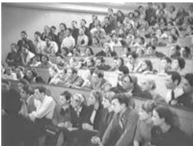
Рис. 4. Кадр из фильма «Закон жизни» (1940)

Авторы «Закона жизни» явно подчеркивали замещение личного блага общественным, доминанту общественного начала над личным. Неслучайно Наталья Бабанова – жертва коварного соблазнителя и предателя Огнерубова, раскрывает на общем комсомольском собрании как на исповеди свою личную драму, которую боялись обсуждать между собой даже члены ее семьи, тем самым обличая скрытого врага молодежи Огнерубова, отравляющего и развращающего сознание неопытного молодого поколения. Она делает это открыто перед всем обществом и во благо этого общества. Ее семейная тайна становится не просто явной, более того, она становится общественным достоянием, тем самым из жертвы Наталья превращается в героиню. Она готова бороться за счастье своей младшей сестры, преодолевая стыд, в котором она жила все эти годы.