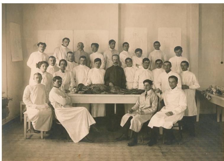
Рис. 1. Фотография советских студентов медицинского института 1940-х годов

- уровень образования: высшее (незаконченное и полное) образование.