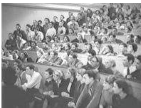
Кадр из фильма «Закон жизни» (1940)

- решение проблемы: товарищеский суд комсомольцев на общем собрании разоблачает скрытых врагов и их пагубные антисоветские идеи. Опытное старшее поколение раскрывает глаза на правду заблуждавшимся студентам, которые поддались влиянию отрицательных персонажей, а те, в свою очередь, раскаиваются и отрекаются от антисоветских идей.