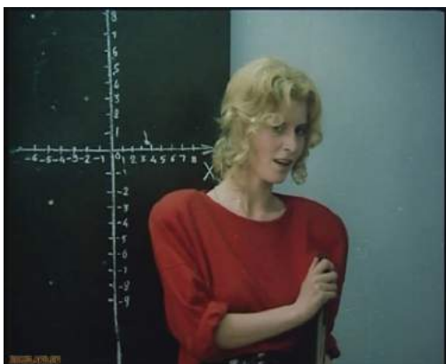
Кадр из фильма «Куколка» (1988)

Существенное изменение в жизни персонажей медиатекстов и возникшая проблема (нарушение привычной жизни):