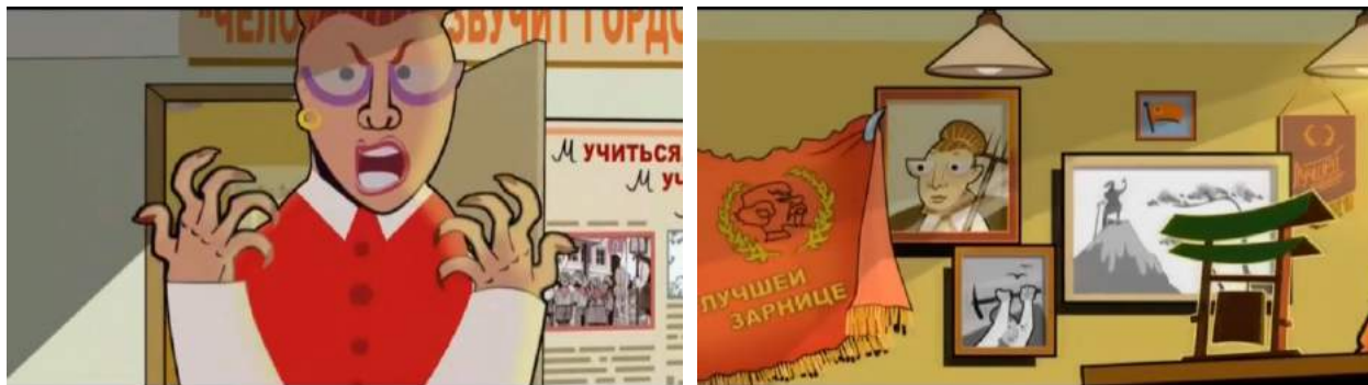
Кадры из мультфильма «Война миров» (2007)

былые идеи зачастую высмеиваются и преподносятся в неприглядном виде. Например, в мультфильме «Война миров» (2007) о жизни учеников 5-7 классов обычной современной школы, где идет постоянная борьба школьников с администрацией, завуч с красноречивой фамилией Зверева представлена как резко отрицательный и комичный персонаж с «пионерским» прошлым. Причем в основе сюжета лежит совсем не учебный процесс, а именно «война» в основном с завучем школы, ученики в ходе этой борьбы строят хитрые планы, обманывают родителей, и все же оказываются победителями в этой схватке. И, по словам главных героев, эта «война» продолжится пока «учителя не научатся их уважать!».