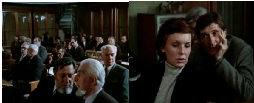
Кадры из фильма «Кафедра» (1982)

Выводы. Итак, мы приходим к выводам, что советский кинематограф на студенческую тему эпохи «застоя»: