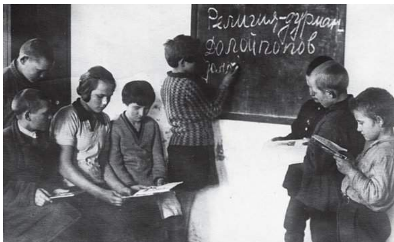
Советские школьники 1920-х годов на уроке в школе