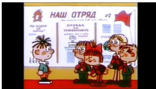
Кадр из мультфильма «Проделки в школе» (1974)

Герои советских мультфильмов – это юные октябрята и пионеры, они следуют идеям коммунизма, всегда готовы прийти на помощь, дружны, честны и трудолюбивы. Частый атрибут положительного героя – пионерский галстук.