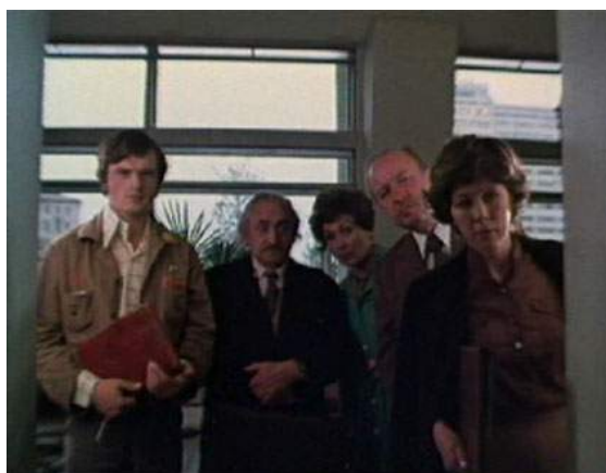
Кадр из фильма «Баламут» (1978)

Кадры из фильмов эпохи «застоя» на студенческую тему, представленные ниже, отражают образы советских преподавателей вузов тех лет.