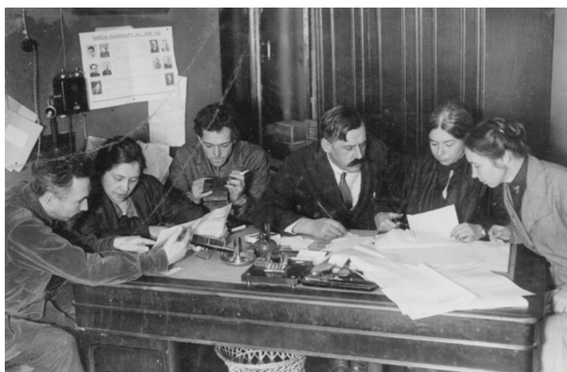
Советские учителя 1920-х годов

Существенное изменение в жизни персонажей медиатекстов: паренек живет своей обычной жизнью, но узнает о том, что его ровесники уже вступили в пионерскую организацию.