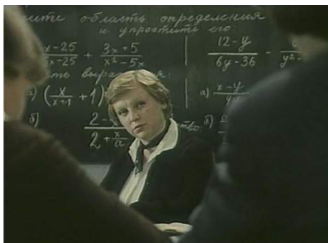
Кадр из фильма «Если верить Лопотухину» (1983)