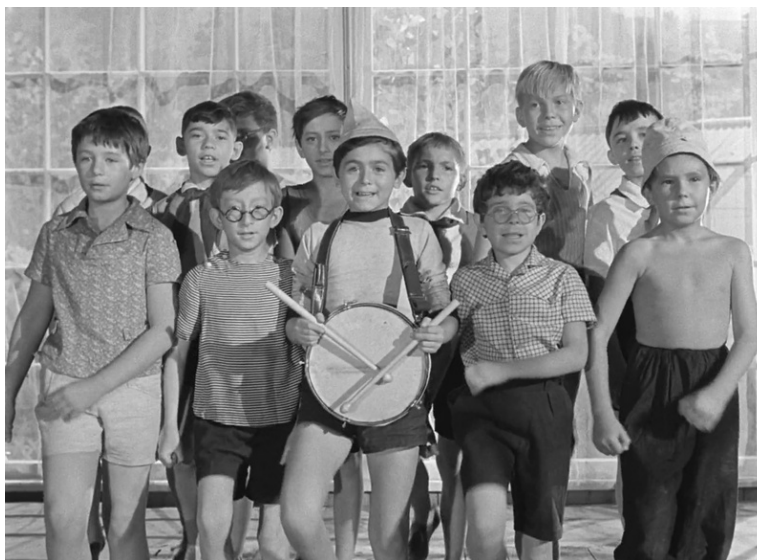
Кадр из фильма «Добро пожаловать, или Посторонним вход воспрещен» (1964)

«Телеграмма») наконец обращаются к образу «ребенка играющего», который «сталинское» кино полностью изъяло из сферы своего познания, заменив игру, естественную для детского возраста, на общественно-полезные занятия» [Артемьева, 2015, с. 19].