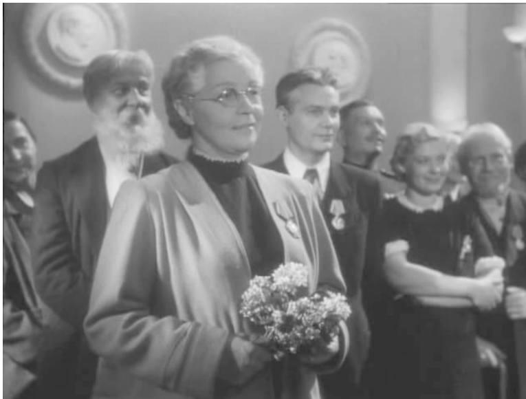
Кадр из фильма «Сельская учительница» (1947)

Кадр из фильма «Сельская учительница» (1947) отражает внешний вид, одежду, телосложение персонажей-педагогов тех лет.