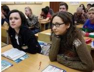
Кадр из фильма «Школа» (2010)

Школьники и студенты в российских фильмах 1992–2017 годов, в отличие от аналогичных персонажей советских фильмов, изъясняются с помощью грубой жаргонной, иногда даже матерной лексики, хотя, разумеется, есть и фильмы, где этого нет, или почти нет (например, «Частное пионерское», 2012).