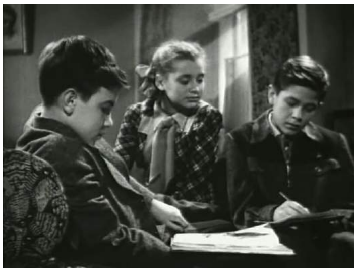
Кадр из фильма «Красный галстук» (1948)

Кадр из фильма «Красный галстук» (1948) дает хорошее представление о внешнем виде, одежде, телосложении персонажей – школьников.