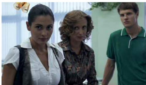
Кадр из фильма «Физика или химия» (2011)

Кадр из фильма «Физика или химия» (2011) отражает внешний вид, одежду, телосложение персонажей-педагогов постсоветских лет.