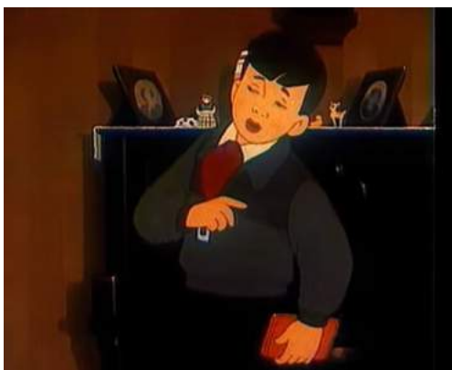
Кадр из мультфильма «Волшебный магазин» (1953)

образ жизни, активист (октябренок, пионер или комсомолец в советский период), представляющий правильные ориентиры в поведении, моральные и нравственные ценности.