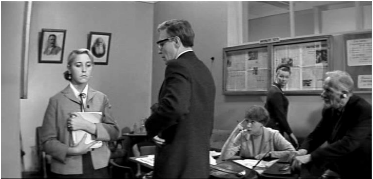
Кадр из фильма «Доживем до понедельника» (1968)

Негативное изображение школы и педагогов «царского режима» в эпоху «оттепели» занимало в советском кино маргинальное место («Первая бастилия», 1965).