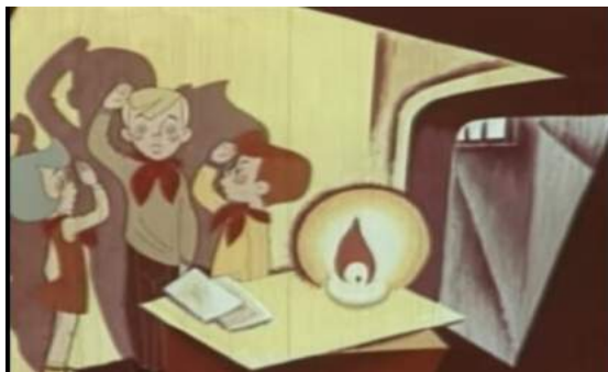
Кадр из мультфильма «Приключения красных галстуков» (1971)

Тема патриотизма также освещается мультипликаторами, в 1971 году был выпущен мультфильм «Приключения красных галстуков» о массовом героизме детей в годы Великой Отечественной войны.