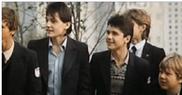
Кадр из фильма «Пощечина, которой не было» (1987)

Кадр из фильма «Пощечина, которой не было» (1987) дает представление о внешнем виде, одежде, телосложении персонажей – школьников эпохи «перестройки»