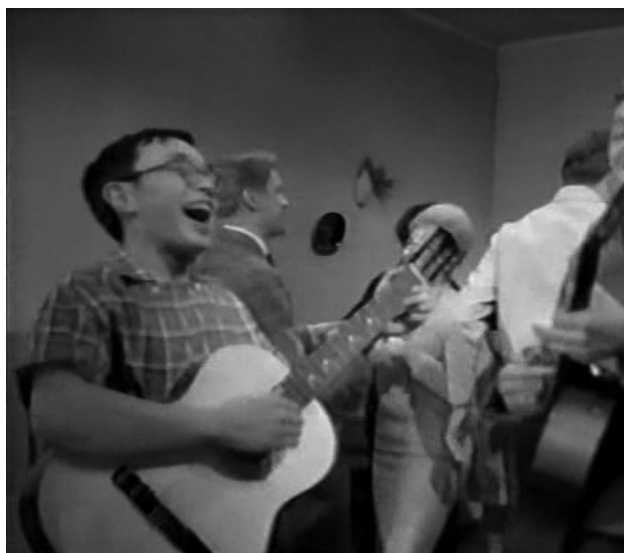
Кадр из фильма «Улица Ньютона, дом 1» (1963)

Тогда же появилось известное противостояние «физиков» и «лириков» («Улица Ньютона, дом 1», 1963), которые, на самом деле вполне гармонично сосуществовали: студенты сообщества создавали студенческие театры и стенгазеты, активно участвовали в научной жизни института, спорили на товарищеских вечеринках и застольях.