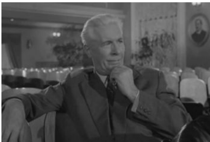
Кадр из фильма «Приходите завтра» (1962)

Выводы. Итак, в ходе герменевтического анализа советских игровых фильмов эпохи «оттепели» на студенческую тему мы приходим к выводам, что советский кинематограф эпохи «оттепели», опиравшийся на коммунистическую идеологию: