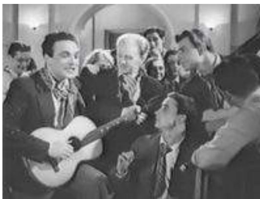
Кадр из фильма «Закон жизни» (1940)

Авторы «Закона жизни» явно подчеркивали замещение личного блага общественным, доминанту общественного начала над личным. Неслучайно Наталья Бабанова – жертва коварного соблазнителя и предателя Огнерубова, раскрывает на общем комсомольском собрании как на исповеди свою личную драму, которую боялись обсуждать между собой даже члены ее семьи, тем самым обличая скрытого врага молодежи Огнерубова, отравляющего и развращающего сознание неопытного молодого поколения. Она делает это открыто перед всем обществом и во благо этого общества. Ее семейная тайна становится не просто явной, более того, она становится общественным достоянием, тем самым из жертвы Наталья превращается в героиню. Она готова бороться за счастье своей младшей сестры, преодолевая стыд, в котором она жила все эти годы.