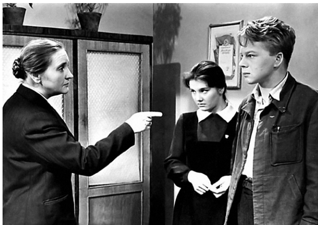
Кадр из фильма «А если это любовь?» (1961)

Иерархия ценностей. На первый план в фильмах школьной тематики выходили вечные ценности: добро, справедливость, честность, порядочность, умение любить, противопоставленные бездушию, мещанству, ханжеству, злобе, предательству, мещанству. Эта вечная борьба, зачастую драматичная и полная противоречий, показана в фильмах о первой любви: «Это было весной» (1959), «А если это любовь?» (1961), «Дикая собака Динго» (1962) и др.