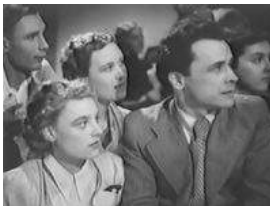
Кадр из фильма «Закон жизни» (1940)

Кадр из фильма «Закон жизни» (1940) отражает внешний вид, одежду, телосложение персонажей-студентов тех лет.