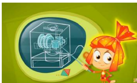
Кадр из мультсериала «Фиксики. Посудомоечная машина» (2017)

На сегодняшний день мультфильмы о школе не столь актуальны. Работы, в которых можно увидеть школьников как таковых, учебный процесс, жизнь школы («Эволюция Петра Сенцова» (2005), «Война миров» (2007) практически не встретить на экранах телевизоров. Очень востребованы познавательные, развивающие, обучающие мультфильмы и интерактивные игры на их основе, где уже полюбившиеся герои мультипликационных сериалов рассказывают детям о правилах дорожного движения, нотах, цифрах и буквах и т.п. («Смешарики» (с 2004 г.), об устройстве различной техники («Фиксики» (с 2010 г.), об изобретениях учёных всего мира «Новаторы» (2011) и др.