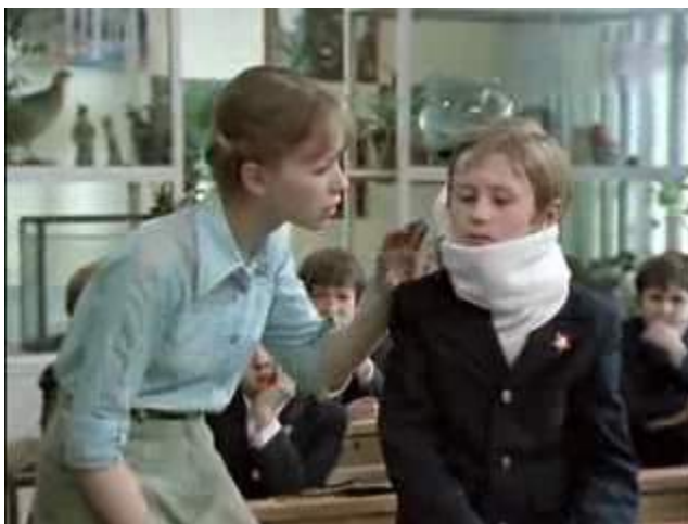
Кадр из фильма «Тихие троечники» (1980)

Кадры из фильмов «Тихие троечники» (1980) и «Если верить Лопотухину» (1983) отражают внешний вид, одежду, телосложение персонажей-педагогов «застойных» лет.