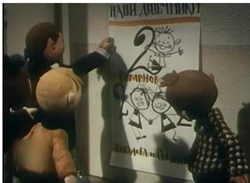
Кадр из мультфильма «Федя Зайцев» (1948)

отвергались одноклассниками и обществом. В сюжетах прослеживалось очевидное противопоставление добра и зла, хорошего и плохого, а отрицательные герои в итоге становились на путь исправления («Жизнь и страдания Ивана Семенова», 1964; «Федя Зайцев», 1948 и др.).