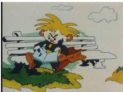
Кадр из мультфильма «Проделкин в школе» (1974)

Вариант № 2. Отрицательный персонаж: школьник, пассивный, двоечник, бездельник, неопрятный, олицетворяющий аморальные нормы поведения.