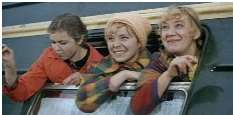
Кадр из фильма «Это мы не проходили» (1975)

Кадр из фильма «Это мы не проходили» (1975), представленный ниже, отражает внешний вид, одежду, телосложение персонажей-студентов тех лет.