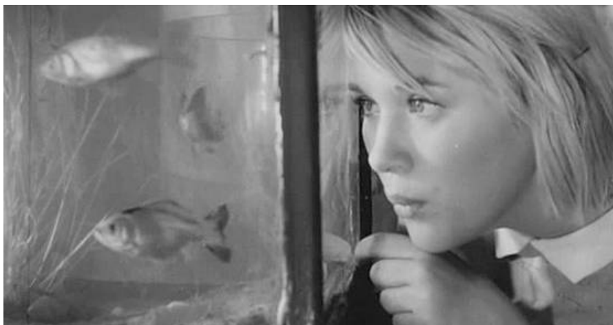
Кадр из фильма «Дикая собака Динго», 1962

В фильмах «Флаги на башнях» (1958), «Бей, барабан!» (1962), «Первый учитель» (1966), «Республика ШКИД» (1966) в качестве положительного был показан педагогический опыт советских педагогов (А.С. Макаренко, В.Н. Сороки-Росинского и др.) и пионерского движения 1920-х годов. В лентах «Тучи над Борском» (1960), «Чудотворная» (1960), «Грешный ангел» (1962) на школьном материале последовательно отражалась антирелигиозная государственная политика. В фильмах «Добро пожаловать, или Посторонним вход воспрещен!» (1964), «Мимо окон идут поезда» (1965) и «Доживем до понедельника» (1968) были показаны педагоги/воспитатели с серьезными профессиональными недостатками. А в фильмах «Повесть о первой любви» (1957), «А если это любовь?» (1961), «Дикая собака Динго» (1962), «Я вас любил...» (1967) довольно остро для того времени ставилась проблема любовных отношений школьников.