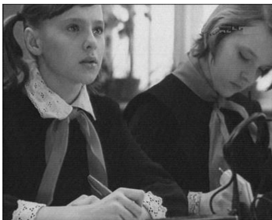
Кадр из фильма «Перевод с английского» (1972)

Кадр из фильма «Перевод с английского» (1972) дает хорошее представление о внешнем виде, одежде, телосложении персонажей–школьников начала 1970-х.