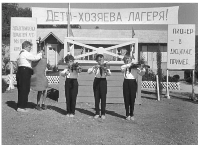
Кадр из фильма «Добро пожаловать, или Посторонним вход воспрещен!» (1964)