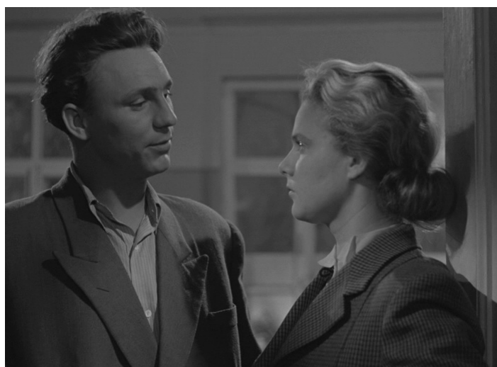
Кадр из фильма «Весна на Заречной улице» (1956)

Педагоги из фильмов раннего периода «оттепели» внешне выглядели примерно так же, как и в лентах 1930-х – 1940-х: их отличала «скромность в одежде. Одежда учителей вне моды. Она похожа скорее на некую униформу: костюм темных тонов, состоящий из юбки в комплекте с пиджаком и белой или светлой блузкой, для учительницы. И тот же темный костюм, белая рубашка и галстук – для учителя. Обязательной обувью были туфли или ботинки. Классическая прическа учительницы – это собранные в узел волосы (Татьяна Сергеевна (учительница из фильма «Весна на Заречной улице» – А.Ф.) дома ходит с распущенными волосами, но, собираясь на работу, собирает волосы в пучок)» [Григорьева, 2007].