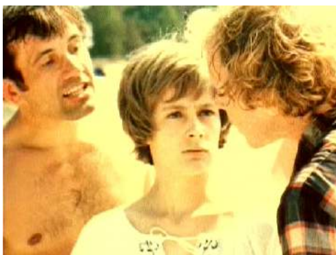
Кадр из фильма «Кузнечик» (1979)