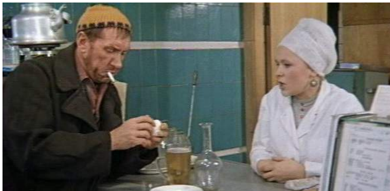
Кадр из фильма «Это мы не проходили» (1975)