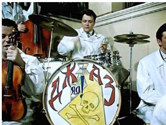
Кадр из фильма «Разные судьбы» (1956)

С другой стороны, активизировалось молодежное движение в стране, студенты формировали основной «костяк» творческой интеллигенции: они всегда были в центре главных культурных событий страны, будь то выставка живописи П. Пикассо в 1956 году в Москве или открытие первого в Союзе джазового кафе «Молодежное». Хотя джаз, к слову сказать, тогда еще не был, так сказать, на полном «легальном положении».