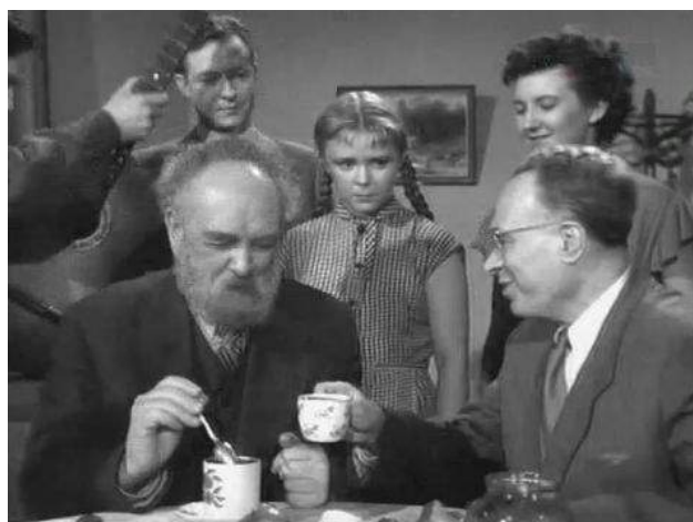
Кадр из фильма «Они встретились в пути» (1957)

Кадры из фильмов эпохи «оттепели» на студенческую тему, представленные ниже, отражают советских профессоров вузов тех лет.