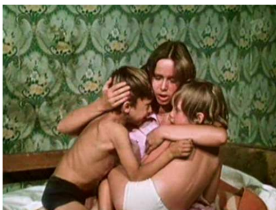
Кадр из фильма «Контрольная по специальности» (1981)