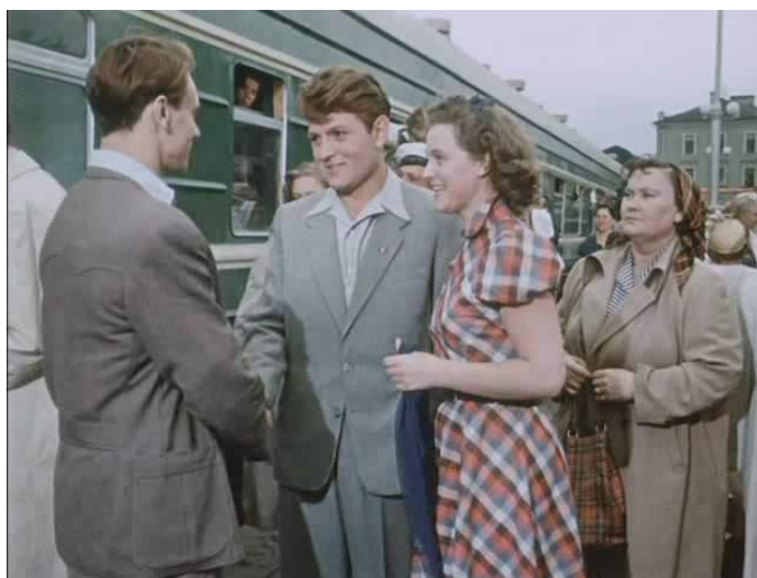
Кадр из фильма «Разные судьбы» (1956)

Кадр из фильма «Разные судьбы» (1956) отражает внешний вид, одежду, телосложение персонажей-студентов тех лет.