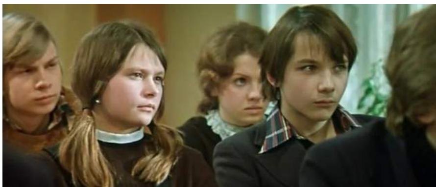
Кадр из фильма «Розыгрыш» (1976)