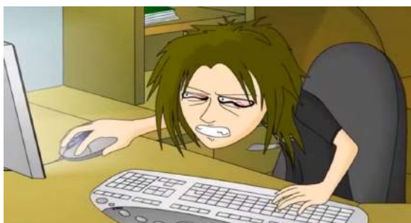
Кадр из мультсериала «Школа - 13» (2014)

Современные мультфильмы о школе часто не несут в себе воспитательных функций: яркая, с увлекательным сюжетом и применением новых технологий анимация, скорее – развлекательный продукт. При этом доступность информации любого рода, а также отсутствие цензуры, способствует появлению мультипликационных фильмов про школу и школьников совсем не позитивного характера. В качестве примера можно привести мультсериал ставший хитом Рунета под названием «Школа – 13» («School – 13»). С 2004 года серии о подростке Диме набирают популярность среди молодежи. Темы сюжетов близки и понятны нынешним подросткам, они узнают в действиях главного героя себя и распространенные жизненные школьные ситуации, которые возможно, происходят и в их классе, школе. Однако главный герой ленив, все свободное время проводит за компьютерными играми, отвечая на уроках «наугад» получает хорошие оценки, в результате чего делает вывод, что учиться серьезно вовсе необязательно. При этом тексты буквально переполнены нецензурной лексикой.