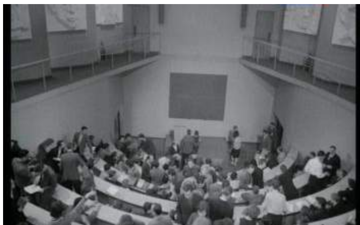
Кадр из фильма «Улица Ньютона, дом 1» (1963)