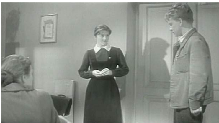
Кадр из фильма «А если это любовь?» (1961)

Педагоги из фильмов раннего периода «оттепели» внешне выглядели примерно так же, как и в лентах 1930-х – 1940-х: их отличала «скромность в одежде. Одежда учителей вне моды. Она похожа скорее на некую униформу: костюм темных тонов, состоящий из юбки в комплекте с пиджаком и белой или светлой блузкой, для учительницы. И тот же темный костюм, белая рубашка и галстук – для учителя. Обязательной обувью были туфли или ботинки. Классическая прическа учительницы – это собранные в узел волосы (Татьяна Сергеевна (учительница из фильма «Весна на Заречной улице» – А.Ф.) дома ходит с распущенными волосами, но, собираясь на работу, собирает волосы в пучок)» [Григорьева, 2007].