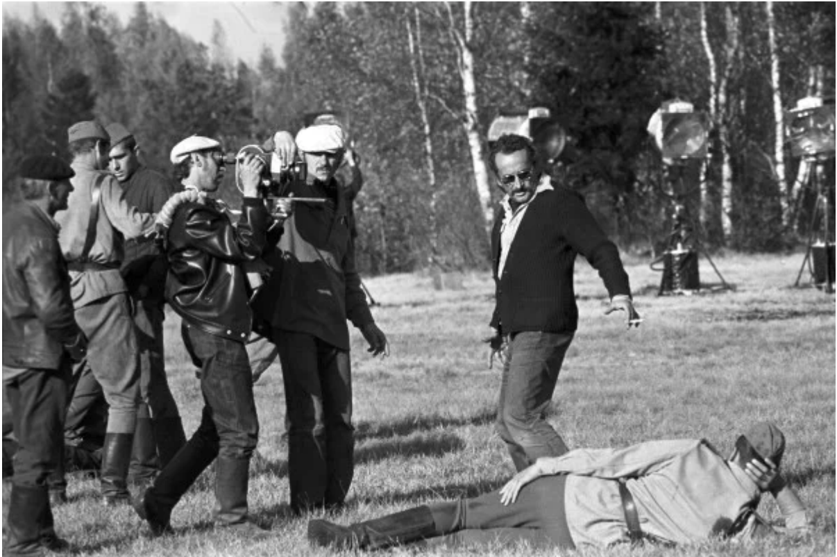
Режиссер В. Жалакявичюс на съемках "Момент истины" (1975)

- Я знаю много примеров, когда материал называли гениальным, а готовый фильм получался посредственным, и наоборот. Помню, как хвалили материал фильма «Красные колокола», «Память», и как ругали материал фильмов «Баллада о солдате», «Белорусский вокзал», «Гори, гори моя звезда»... Это все равно, что судить о скульптуре Родена по руке, уху или башмаку... Целиком надо смотреть!