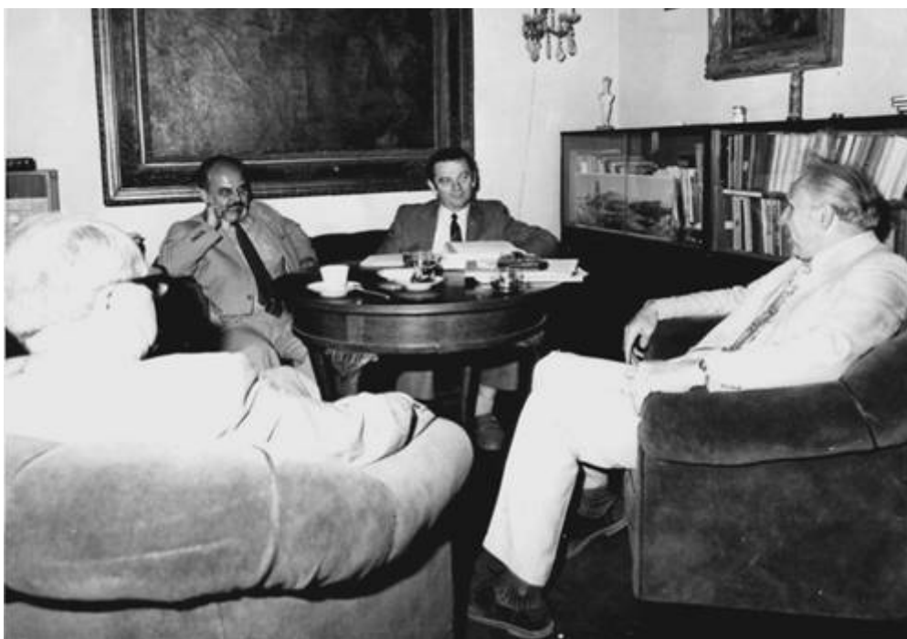
Обсуждение монографии в деканате философского факультета Карлова университета