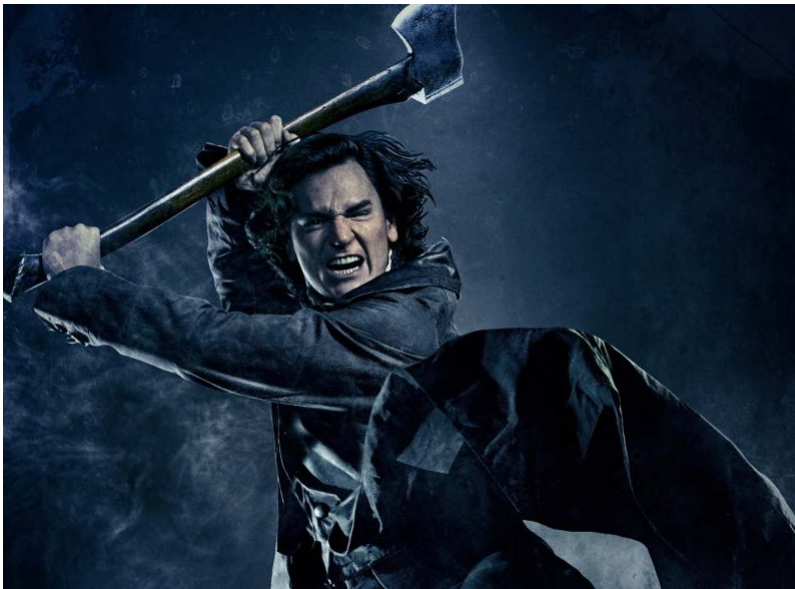
«Президент Линкольн: Охотник на вампиров»

- А у Вас после «Президента Линкольна...» не возникала мысль остаться в Голливуде, чтобы развивать свою дальнейшую карьеру?