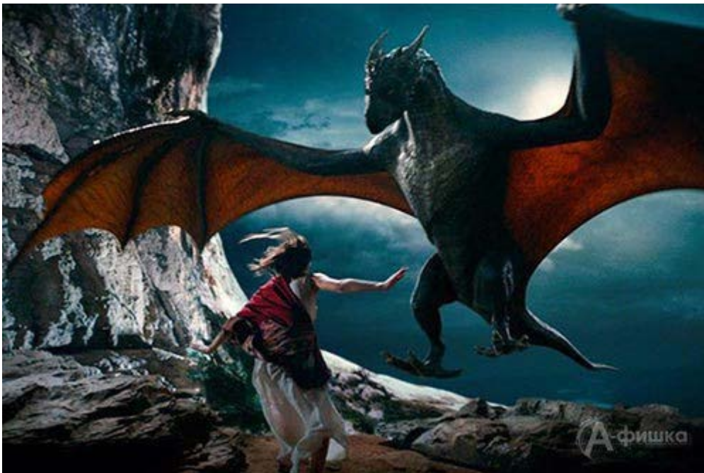
Он - дракон

Потом, когда я вернулся в Россию и стал снова работать в Москве, у меня не было никогда ощущения, что я что-то упустил. И до сих пор такое ощущение. Хотя понятно, что если бы я остался работать в Лос-Анджелесе, моя жизнь сложилась бы иначе. Но лучше ли? Не знаю.