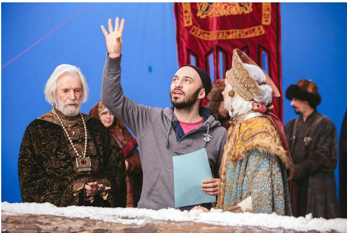
На съемках фильма "Он - дракон"