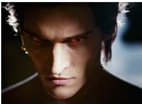
Он - дракон