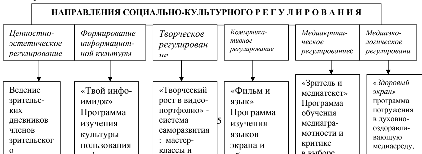
Рисунок 1. Модель программирования творческих и культурных акций, направленная на формирование региональной киноаудитории, интегрированной в различные типы фестивалей.

Ядром модели является центр зрительской культуры участников кинофестивального движения в регионе. В связи с этим актуализируются интересы и медиадосуговые предпочтения, ценностные и духовно-нравственные ориентации зрительской аудитории.