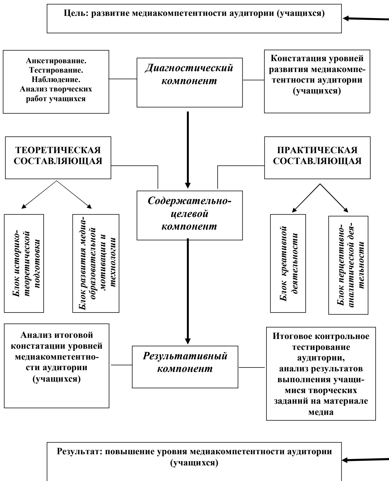
Рис. 1. Светская модель медиаобразования

Основа: синтез социокультурной, культурологической и практико-утилитарной теорий медиаобразования