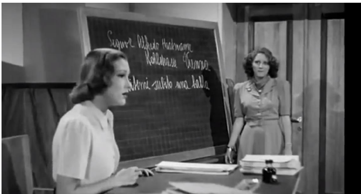
Рис. 1. Кадр из кинофильма «Маддалена, ноль за поведение» (1940)

В контексте нашего исследования нам интересна его комедия «Маддалена, ноль за поведение» (1940), сюжет которой развивается непосредственно в стенах школы делопроизводства, где мы видим различные типажи преподавателей и учениц в школьной среде, за партами и в школьных коридорах, а также трогательную историю о том, как самая непослушная и неугомонная ученица Маддалена, имеющая определенный авторитет в классе, проникнувшись одиночеством и мечтательностью молодой и неопытной учительницы, помогает ей не только улучшить свое положение как педагога, но и устроить личную жизнь.