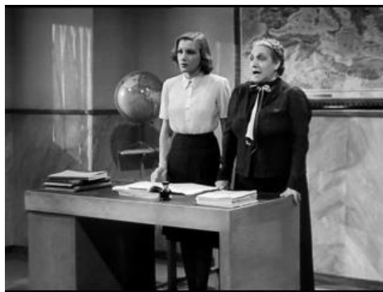
Рис. 4. Кадр из кинофильма «Учительница Кадр из кинофильма естественных наук» (1976) «Маддалена, ноль за поведение» (1940)

Вариант № 2. Учитель или преподаватель чаще всего имеет строгий и опрятный внешний вид, сдержанный стиль в одежде, в зависимости от сюжета может быть неуклюжим, неловким и жалким, или авторитетным, эрудированным и находчивым.