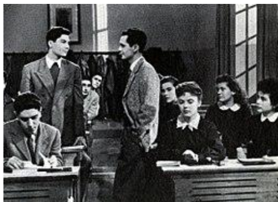
Рис. 2. Кадры из кинофильма «Старшие классы» (1954)

Картину встретили противоречивыми отзывами, из-за присутствия некоторых фривольных по тем временам сцен (поцелуи, игра женской спортивной команды в коротких шортах). Журнал «Rivista del cinematografo» от 15 мая 1954 года писал, что данная картина «допускается для просмотра только для взрослых, достигших полной зрелости людьми» ( Rivista del cinematografo, 1954 ).