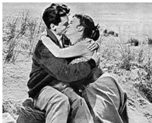
Рис. 3. Кадры из кинофильма «Старшие классы» (1954)