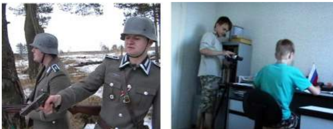
Фото 8-9. На съёмочной площадке: натурные съёмки короткометражного фильма «Песня про зайчика» (2006 г.) и съёмки в квартире короткометражного фильма «Не один» (2011-2012 г.).

Воспитанники видеостудии привлекаются не только к работе над фильмами. Совместно со взрослыми они организуют и проводят мастер-классы, позволяющие детям не только поучаствовать в организаторских мероприятиях, но и самостоятельно презентовать свои работы. С подобными докладами о проделанной работе ребята видеостудии «Кино-Отрок» выезжают в близлежащие образовательные учреждения, выступают на фестивалях и других внешкольных мероприятиях. Воспитанники видеостудии обслуживают и школьные мероприятия, изготавливая тематические слайд-фильмы и видеозарисовки. Они формируют богатый и яркий фотовидеоархив жизнедеятельности всего