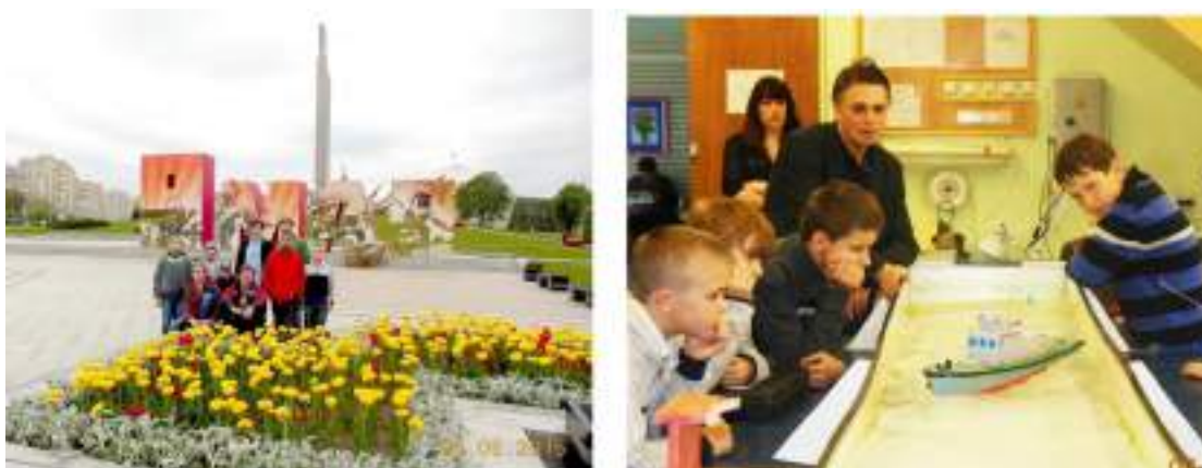
Фото 125-126.