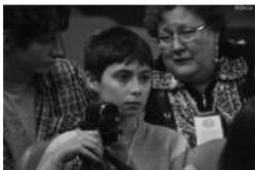
Фото 84-85.

Фестиваль – это единственный сегодня проект, уделяющий внимание разработке научно-методической базы по кинопедагогике и медиаобразованию.