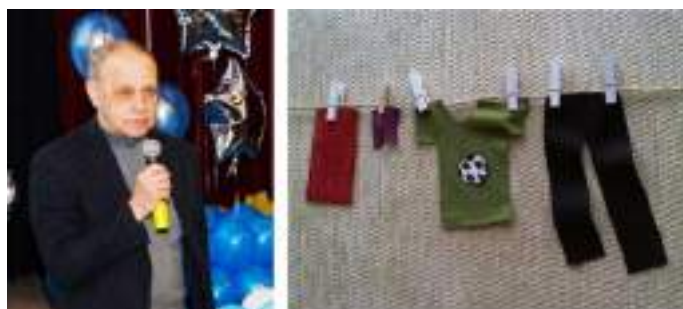
Фото 110-111. Г. Бардин. Кадр из мультфильма «Не зря она футболка!» (видеостудия «Кино-ОТРОК», 2014 г.).

Гостями второго дня фестиваля стали легендарный режиссер-аниматор Гарри Бардин и режиссер студии «Пилот» Сергей Меринов. Они провели творческие встречи, показали свои мультфильмы и ответили на вопросы юных мультипликаторов.