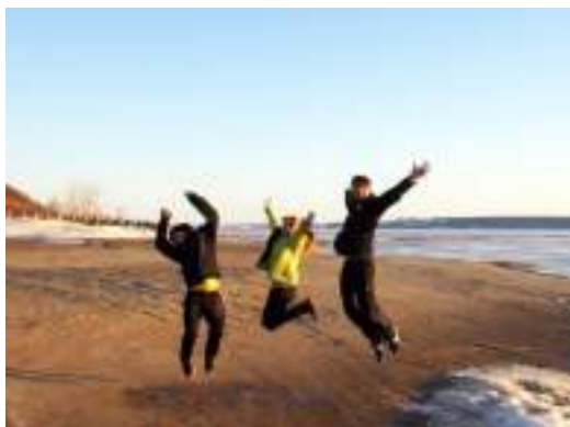
Фото 10. На Международном фестивале детско-юношеской журналистики и экранного творчества «Волга-Юнпресс» (март 2015 г.). Фотография отмечена дипломом фотоконкурса «Фестиваль в лицах».

Со всероссийских фестивалей воспитанники привозят диски с записями работ-лауреатов. Этого материала оказывается достаточно для проведения два раза в год общешкольного фестиваля детского экранного творчества видеостудий Российской Федерации. Таким образом, детский коллектив школы-интерната, вслед за ребятами