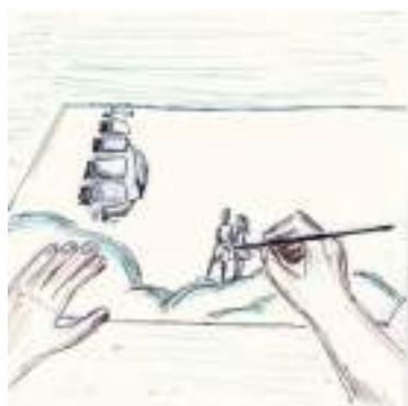
Фото 15-16. Кадры из мультфильмов видеостудии: «Художник» (2010 г.), «Да или Нет» (2012 г.).

приобрели опыт работы в школьной видеостудии, будет намного легче социализироваться в обществе и приспособиться к жизни за стенами интернатного учреждения.