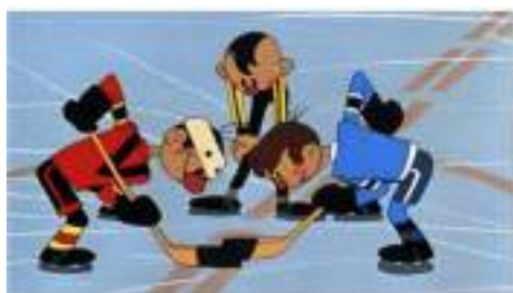
Фото 107-109. Кадры из мультфильмов «Шайбу! Шайбу!» (1964 г.), «Военная инструкция» (2014 г.), «Дерево с золотыми яблоками» (2000 г.).

Мультфильм «Дерево с золотыми яблоками» (реж. Н. Дабижа) вызвал неподдельное переживание за судьбу главного героя и бурю негодования в адрес его братьев. Когда же дело дошло до показа «Шайбу! Шайбу!» (реж. Б. Дежкин), зал громко «болел» за команду «синих». После того, как был забит решающий гол, в зале раздались аплодисменты.