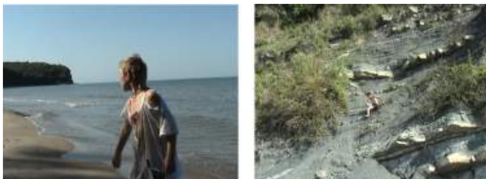
Фото 6-7. Кадры из короткометражных фильмов «Остров сокровищ» (2007 г.) и «Один» (2008-2009 гг.), снятых на черноморском побережье ВДЦ «Орлёнок».

С другой стороны, есть и минус работы с детьми в интернатном учреждении – это сложные характеры детей-сирот и детей из неблагополучных семей. У них наблюдается частая смена интересов, неспособность долго сосредотачиваться на одном занятии, и, как правило, низкие интеллектуальные возможности. Из школьного социума всего лишь несколько человек, пройдя программу занятий видеостудии, научились создавать свои короткометражные сюжеты от начала до конца без помощи взрослых. Остальные воспитанники пока ограничиваются в видеостудии второстепенной ролью.