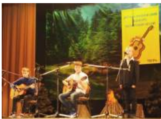
Фото 112. Звучит песня «Паруса Крузентштерна».

Трио из Медновской санаторной школы-интерната, исполнившее песню «Паруса Крузентштерна», получило диплом фестиваля и стало лауреатом приза зрительских симпатий.