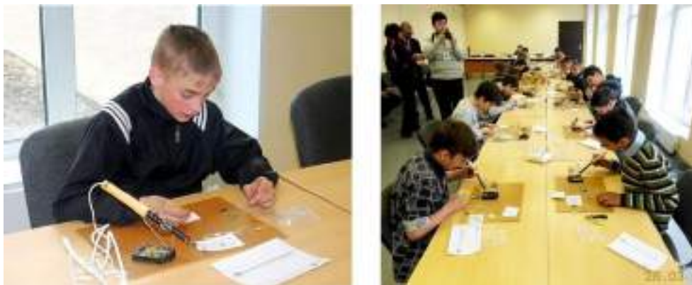
Фото 122-123.

В это время вторая группа участников приступила ко второй практической части конкурса. В соответствии с возрастом конкурсантам были предложены пакетики с набором деталей – при помощи паяльника им необходимо было спаять определённую заданием радиоэлектронную конструкцию. По окончании сборки каждый участник предъявлял свою конструкцию жюри для оценки.