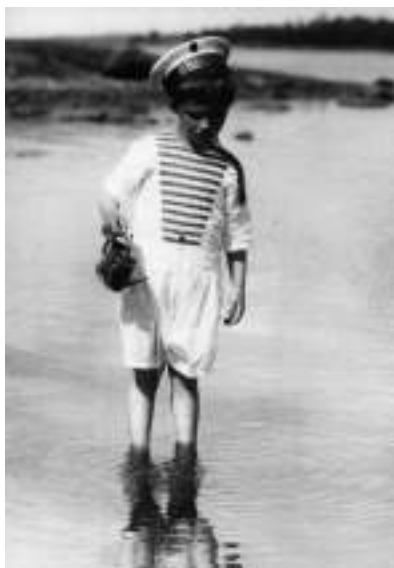
Фото 32. Фотография Царевича Алексея, использованная в фотофильме «Семья».

После обсуждения учитель задаёт детям вопрос: