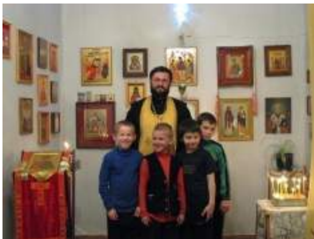
Фото 35.

– Что помогало царской семье на протяжении всей жизни оставаться единой, любящей семьей?