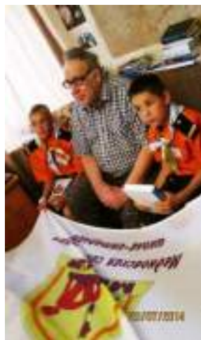
Фото 41. В гостях у любимого писателя (лето 2014 г.).

Особое место в проекте занимают книги Владислава Крапивина. Их герои, живущие в современных условиях, учат детей чести, верности, дружбе. В рамках проекта прошло обсуждение нескольких повестей писателя и их экранизаций – «Трое с площади Карронад», «Дети синего фламинго», «Колыбельная для брата». Событием, несомненно, повлиявшим на жизнь ребят, участвовавших в обсуждении, стали две встречи в гостях у легендарного писателя в г. Екатеринбурге (осенью 2013 г. и летом 2014 г.).