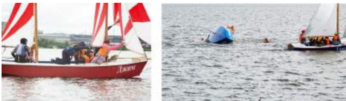
Фото 97-98.