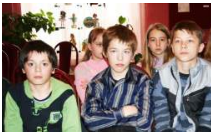
Фото 40. На обсуждении романа «Повелитель мух» (2013 г.).

Кризис детского чтения как одно из проявлений общего кризиса культуры в России на Российском литературном собрании, прошедшем в ноябре 2013 года в Москве, был призван проблемой государственной важности, приравненной к делу обеспечения национальной безопасности страны. Детское чтение и воспитание подрастающего поколения были тесно увязаны между собой. Подчёркивалось, что негативизм к чтению демотивация детей к учёбе, утрата смысла слов «любовь», «дружба», «честь», «совесть», заполнение речевого пространства детской жизни флюидами ненависти и вражды, отчуждение детей друг от друга – это явления одного порядка. Доминантой в решении проблемы воспитания единодушно была названа литература. Говоря о мерах выхода из создавшегося положения, участники Собрания сделали акцент на школе и семье, а президент России В.В. Путин порекомендовал более активно использовать возможности библиотек.