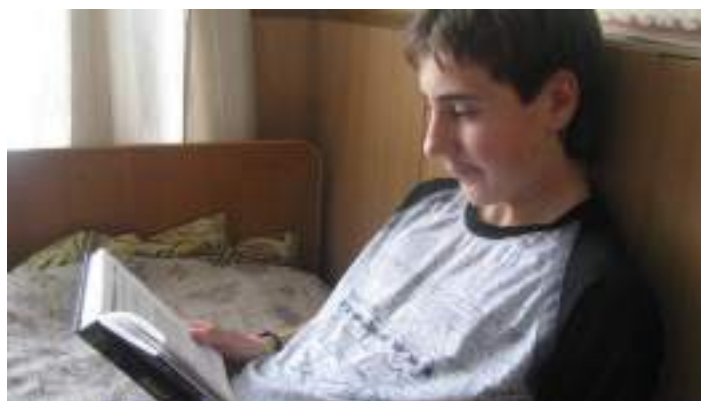
Фото 2.

Очевидно, что печатная информация труднее усваивается и запоминается. Однако именно эта информация лучше структурирована. Информация в виде текстов – основа любого процесса образования и самообразования.