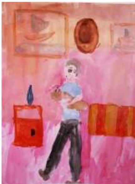
Илл. 42. Из архива изостудии школы-интерната.

Перед нами встают пять поколений, сделавших свой выбор или ожидающие этого выбора – Антошка, Митька, Кирилл, дед, отец . «Пять минут тишины» для Кирилла разворачиваются перед нами в фильме. И вот уже Кирилл оказывается перед выбором: встать в полный рост перед лицом опасности или сбежать от этой опасности. Кирилл делает свой выбор за одну секунду. В похожей ситуации выбора оказываются и другие герои фильма и книги. Здесь следует сослаться и на книгу, потому что некоторые герои в фильме обозначены только схематично. Дети вспомнят Митьку, Женьку, отца, деда.