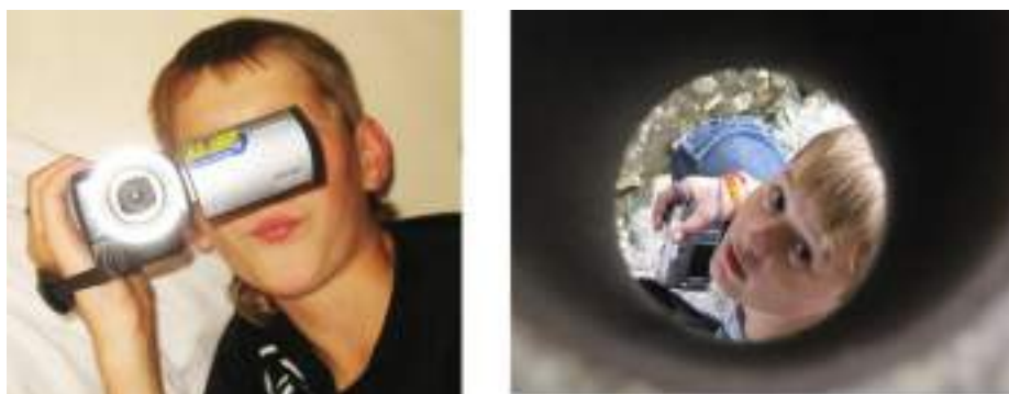
Фото 4-5.

Можно выделить несколько особенностей работы видеостудии в условиях интернатного учреждения. Наверное, одним из главных преимуществ можно назвать доступность детей в дневное и вечернее время. Для того, чтобы собрать детей в вечернее время, не нужно спрашивать разрешения у родителей. Съёмки могут быть назначены на будний, воскресный, праздничный день, в каникулярное время. На сбор детей уходит несколько минут, так как все дети находятся в здании школы. Нет проблем и с организацией выезда съёмочной группы за пределы школы для проведения съёмок на природе.