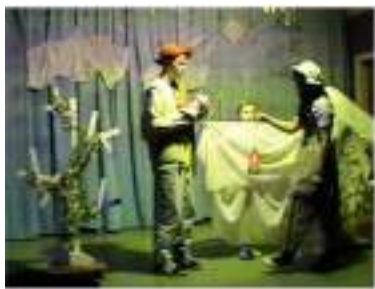
Фото 47-49. Новогодняя театрализованная музыкальная постановка «Звёздный мальчик» (декабрь 2014 г.).