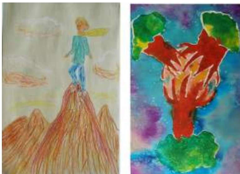
Экскурсия по Стенду 4.

Илл. 73-74.