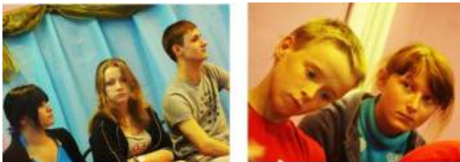
Фото 101-102.

Тема денег вообще сейчас довольно остра. На телевидении, в современной литературе и музыке можно услышать идею о том, что количество денег является выразителем степени таланта, ума и других достоинств человека. Чего стоит расхожая фраза – «Раз ты такой умный, почему же ты такой бедный?»