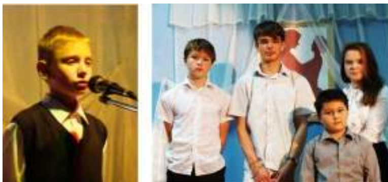
Фото 103-104. Звучит стихотворение Н. Рубцова «Хлеб». Победители конкурса.

Участники и зрители поделились своими впечатлениями: