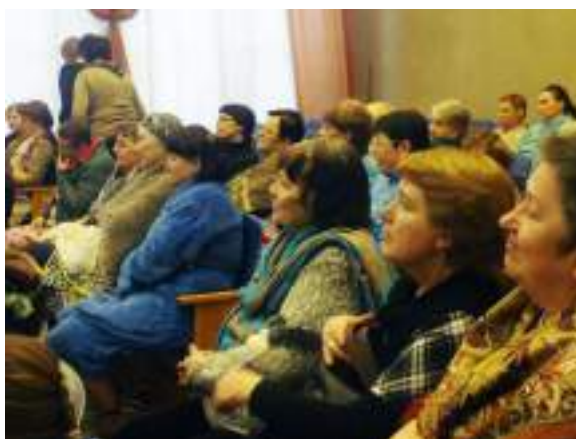
Фото 113. Благодарные зрители.

Как показывает практика, подобные концерты нужны юным воспитанникам не меньше, чем их зрителям. В предновогодние дни,