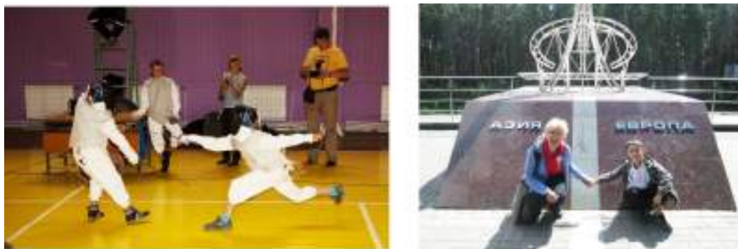
Фото 99-100.