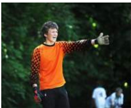
Фото 118-119.