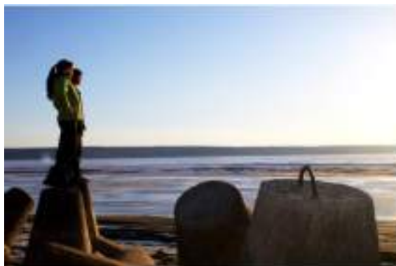
Фото 120-121.