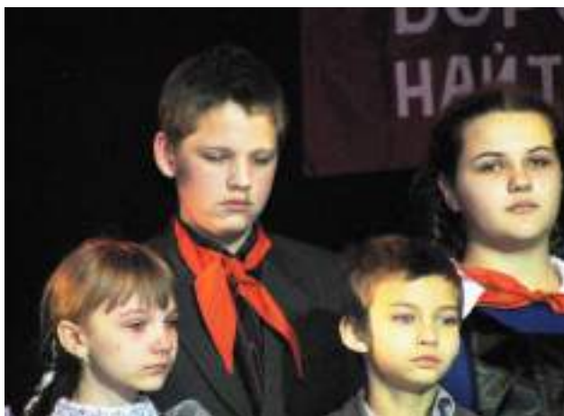
Фото 91.

«Этим проектом нам удалось поднять огромный пласт забытых событий времён Великой Отечественной войны, – убеждена инициатор проекта. – Одна из наших главных задач – связать коллективы предприятий и организаций военных лет, которые собрали в то тяжёлое время необходимые средства для открытия детского дома, и коллективы их современных преемников. Таким образом мы ещё раз выразим людям из далёкого 1942 года благодарность за заботу о детях. Таким образом мы укрепим связь трёх поколений в чутком отношении к своему Отечеству, к своей малой родине».