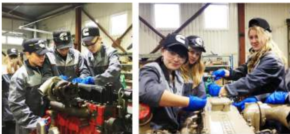
Фото 105-106. Будущие автомеханики.

На заключительном чаепитии подростки делились своими эмоциями и впечатлениями с сотрудниками. Мальчишек и девчонок наградили сертификатом о прохождении учебного курса в центре «Камминз» и подарками с логотипом компании.