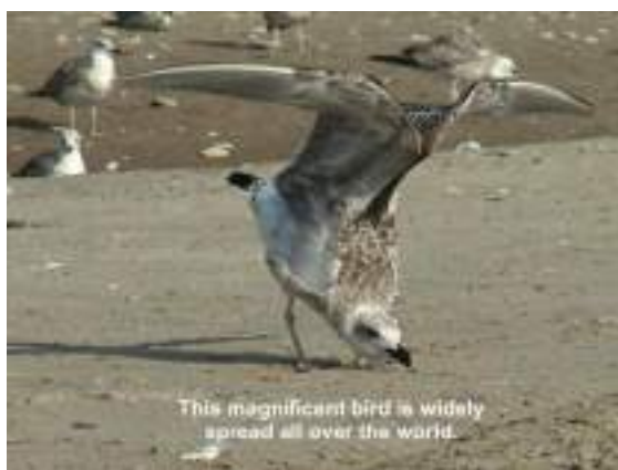
Фото 39. Кадр из пародии на научно-популярный фильм “Seagull” с английскими субтитрами, сделанной в видеостудии в 2009 г.