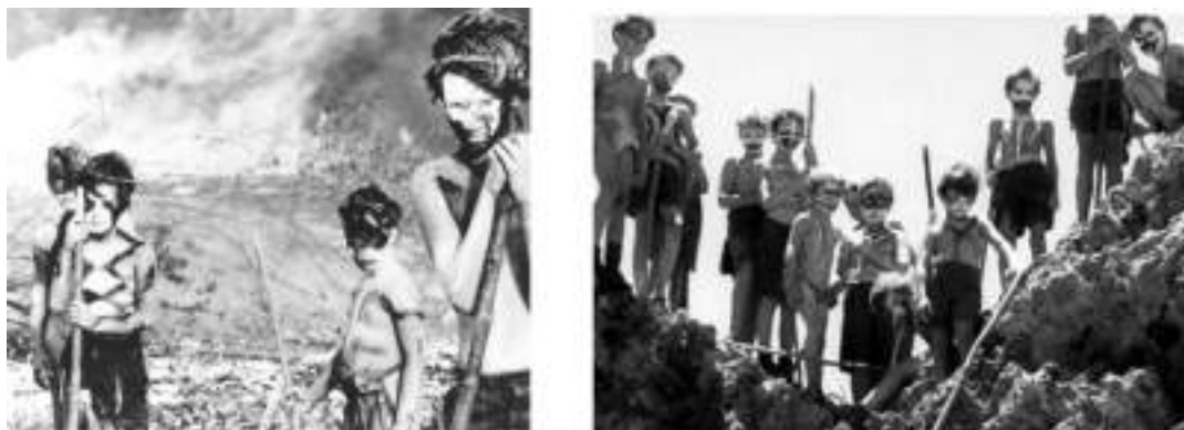
Фото 45-46. Кадры из фильма П. Брука (1963 г.)

Не случайно словосочетание «Повелитель мух» (в романе свинья голова, насаженная на палку) – это перевод имени древнееврейского божества Бааль-Зевува (Вельзевул или дьявол в христианстве).