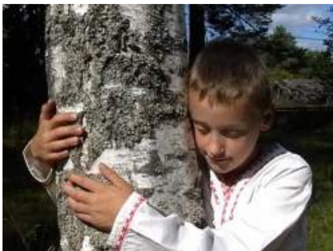
Фото 36. Кадр из видеозарисовки «Страница», снятой в Лесном районе Тверской области (2006 г.).

Демонстрируя на уроках литературы произведения киноискусства, мы использовали показатели сформированности качеств, характеризующих уровень восприятия.