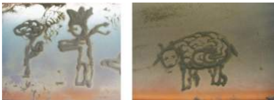
Экскурсия по Стенду 1.

Фото 69-70. Рисунки песком.