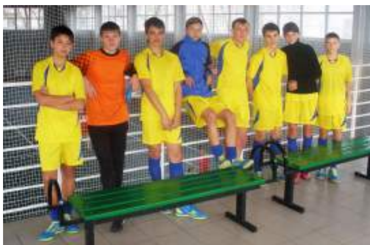
Фото 117. Команда МСШИ.