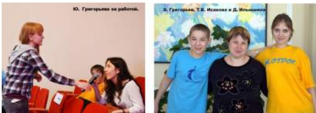
Фото 93-94.

Этап мастер-класса «тележурналистика – игровое кино» проходил в интерактивной форме. Он сопровождался просмотром последних работ видеостудии «Кино-ОТРОК» и их обсуждением. Пожалуй, больше всего участникам запомнилась практическая часть мастер-класса, в ходе которой ребята смогли не только разработать сценарий игрового кино, но и сами разыграть его на сцене.