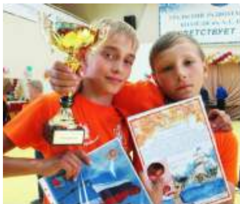
Фото 95-96.