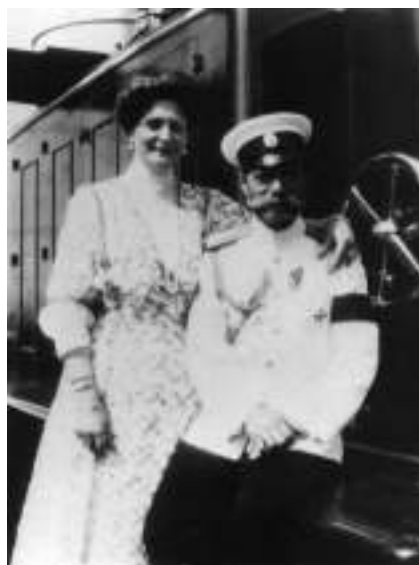
Фото 31. Фотография Императора Николая Александровича Романова и Александры Фёдоровны, использованная в фотофильме «Семья» (видеостудия «Кино-ОТРОК», 2006 г.).