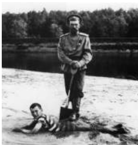
Фото 33. Фотография Императора Николая Александровича и Царевича Алексея, использованная в фотофильме «Семья».

Александра Федоровна с дочерьми часто вязали или шили. Еще одним любимым увлечением царской семьи было клеивать фотографии в альбом. Зимой все играли в снежки, катались на лыжах и санях, строили снежную гору.